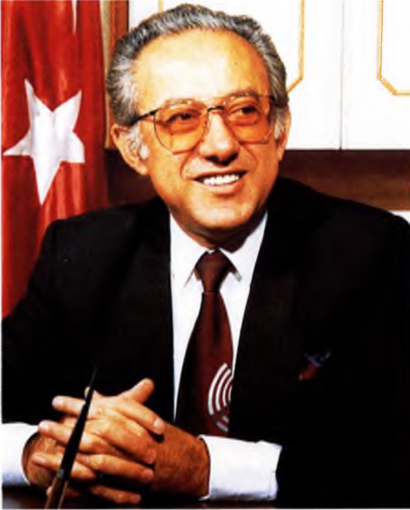
T.C. Millî Eğitim Bakanı Sayın Avni Akyol